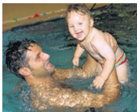
Spaß im Wasser.

wurden vom Spezialveranstalter Babyreisen ausgewählt und geprüft. Familien wohnen in Mobilheimen mit eigenem Babyschlafzimmer. Die Unterkünfte stehen in ruhigen Teilen der Anlage. Bett, Hochstuhl, Bollerwagen und andere Utensilien können gemietet werden, ein Mini-Krabbelclub, Babysitter-Service und eigene Sanitäranlagen für Kleinkin-